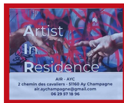
Résidence d'artiste Aÿ-CHAMPAGNE