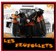
Asso Les Feufollets