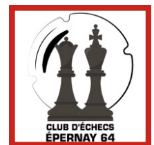
Club Echecs Epernay 64 EPERNAY