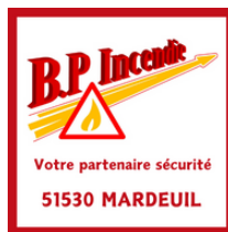
B.P Incendie MARDEUIL