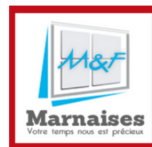
M&F Marnaises ORBAY L'ABBAYE