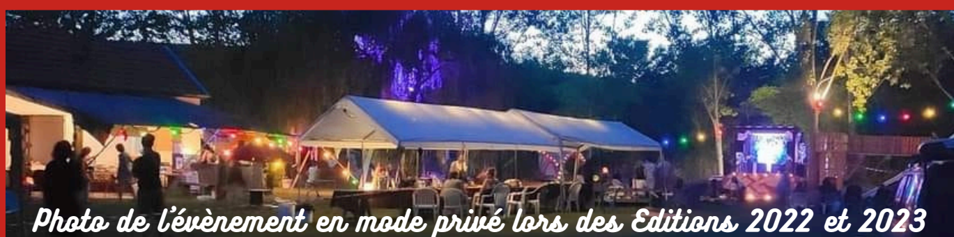
Photo de l'évènement en mode privé lors des Editions 2022 et 2023

Notre définition du MELTING'POTES à nous, c'est avant tout une histoire de famille de cœur, multiculturelle. Certains se connaissent depuis plus de 30 ans, et d'autres se rajoutent au tissage qui se construit au fil des coups de cœur amicaux.